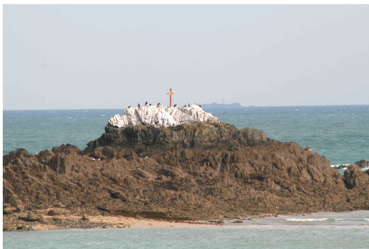
Le Rocher Martin à Plérin connu pour ses courants dangereux

Si le père pouvait à juste titre être fier de la brillante carrière universitaire de son fils, il devait trouver également des motifs de satisfaction sur sa vie d'homme.