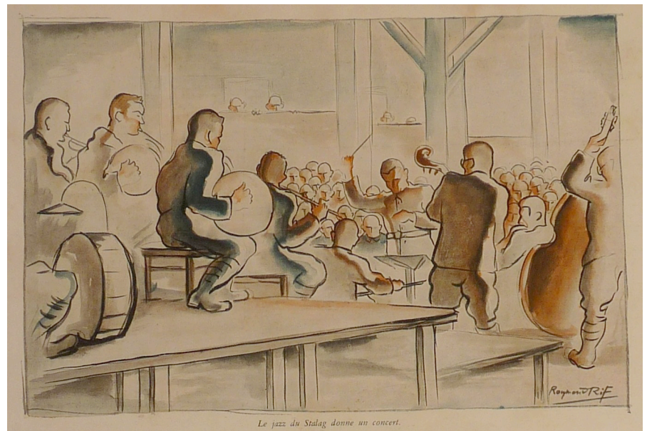
Le jazz du Stalag donne un concert.

L'ILLUSTRATION – N°5117 (5 avril 1941) 3 dessins tirés d'un article sur le Stalag IX A.