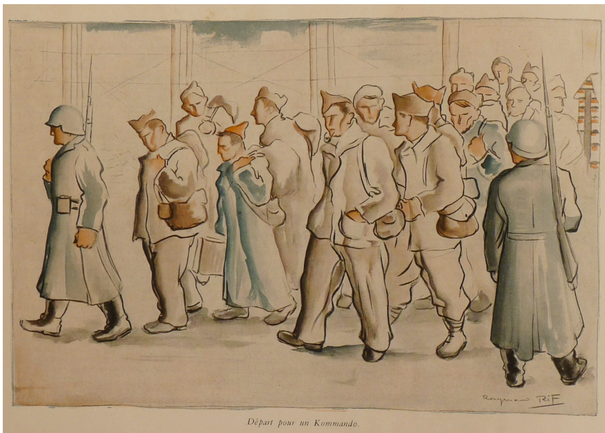
Départ pour un Kommando.